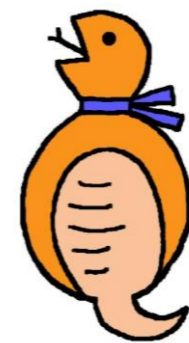
吉井図書館キャラクター つちのこ